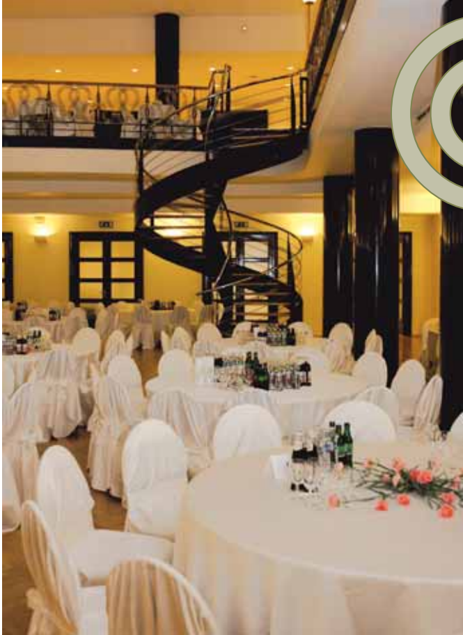
Slávnostne vyzdobená sála čaká na prvých hostí