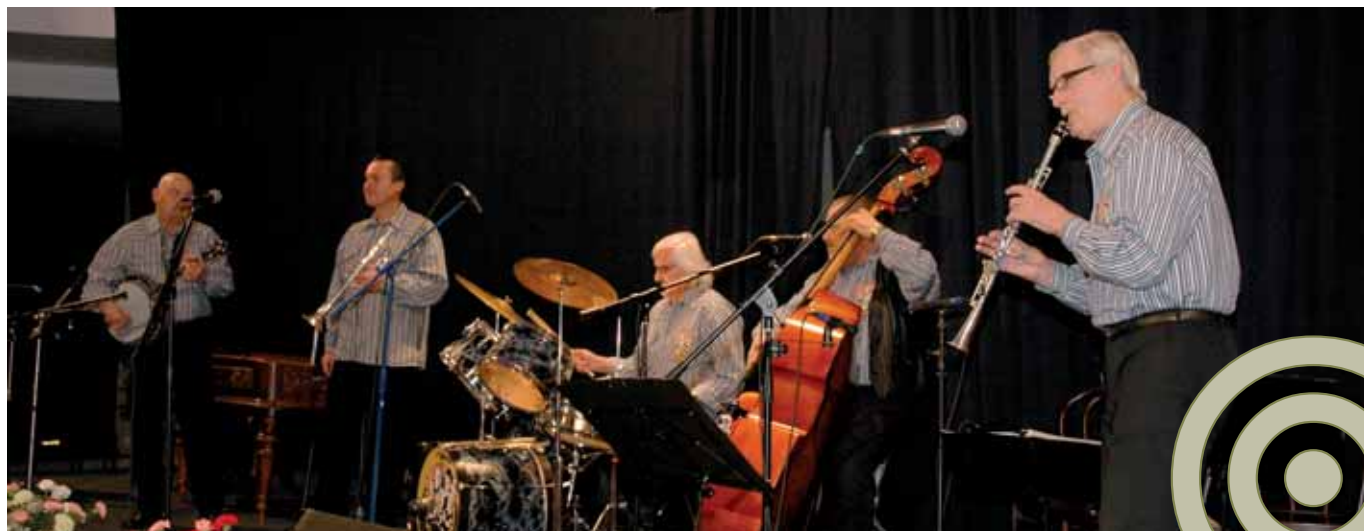
Usporiadatelia plesu sa postarali aj o dostatočnú pestrosť hudobných žánrov, ako o tom svedčí aj momentka z vystúpenia dixielandovej kapely