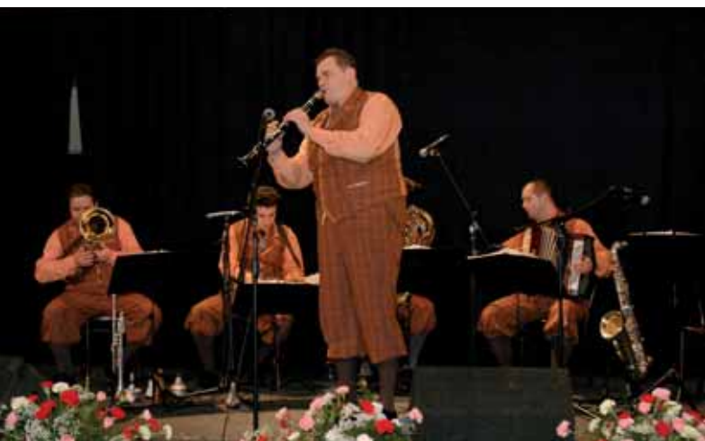
Takto zabávala hostí skupina Funny Felows