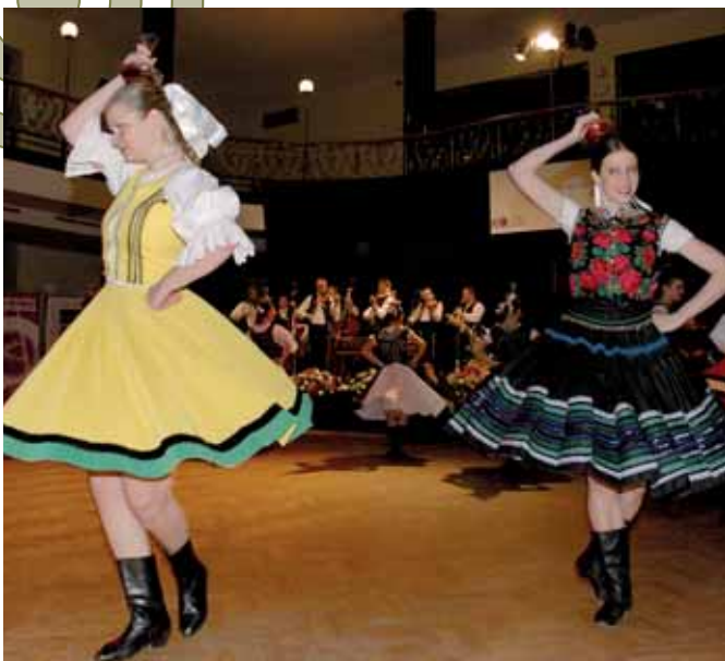
Takto sa plesovým hosťom predstavila pražská Limbora