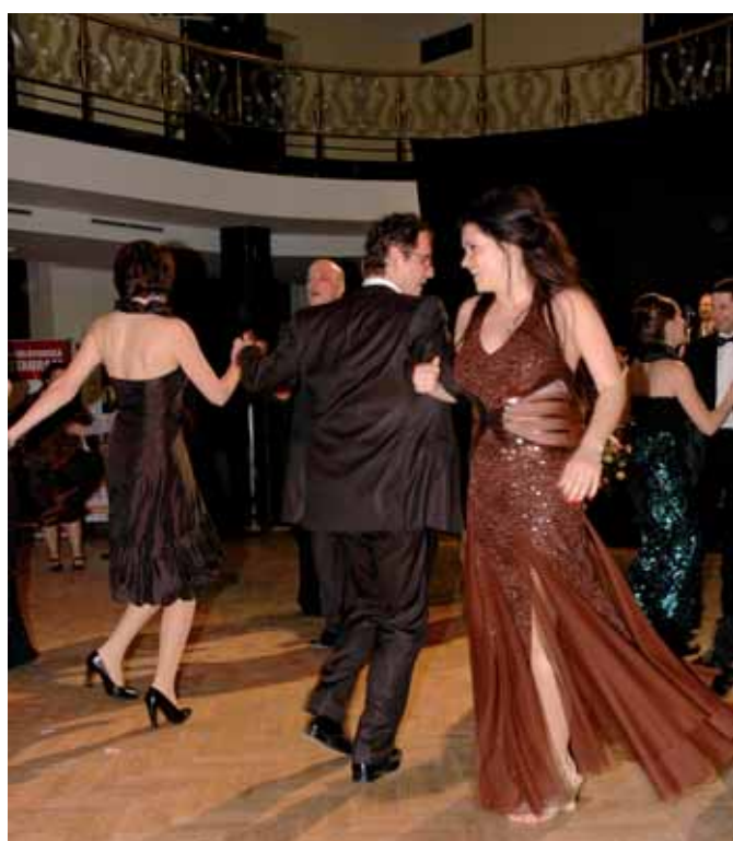
Tento pár zostáva, žiaľ, anonymný, ale za výkon na parkete si obaja aktéri zverejnenie fotografie celkom iste zaslúžia