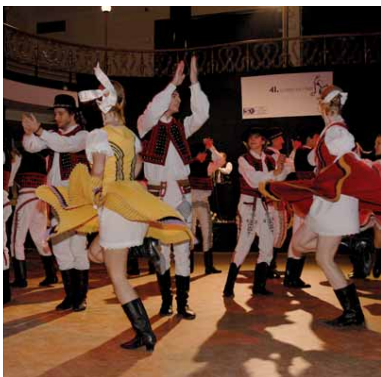
Krása slovenského folklóru