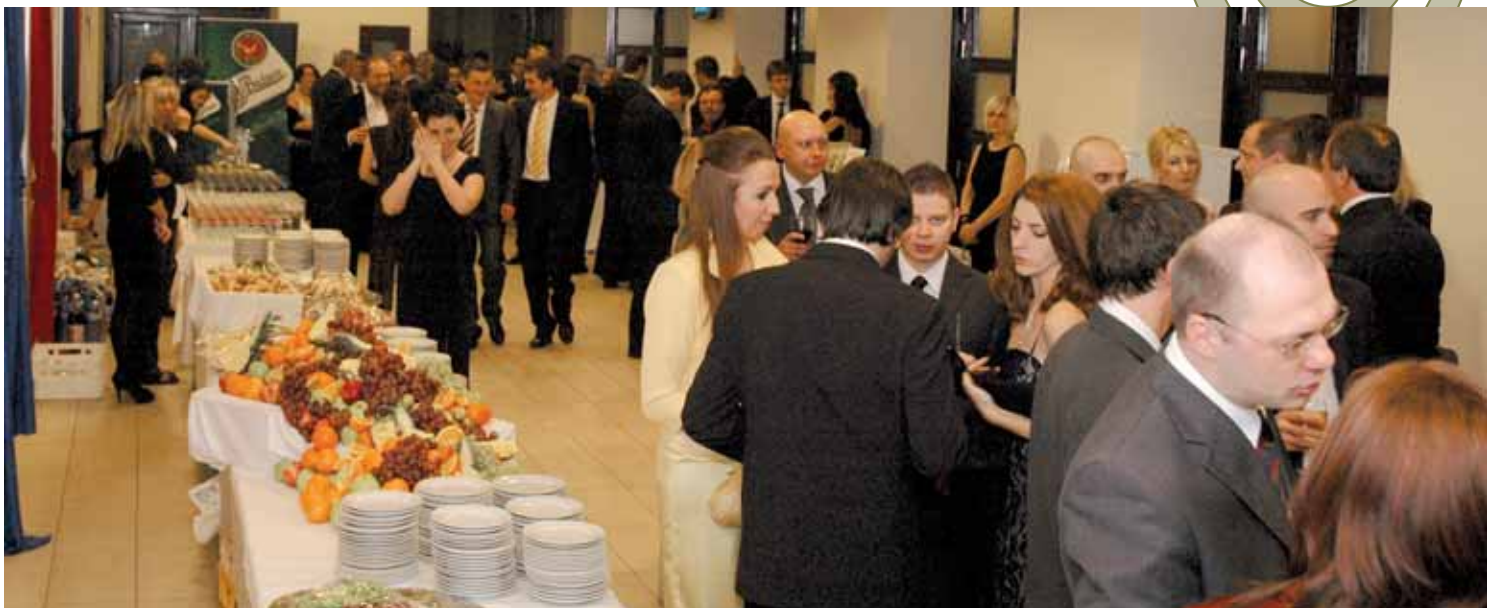
Takému bohatému bufetovému stolu neodolá nikto