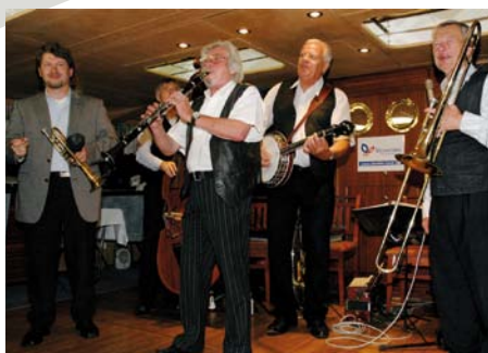
Na slávnostnej akcii odzneli aj piesne v podaní skupiny PRAGUE SWINGERS