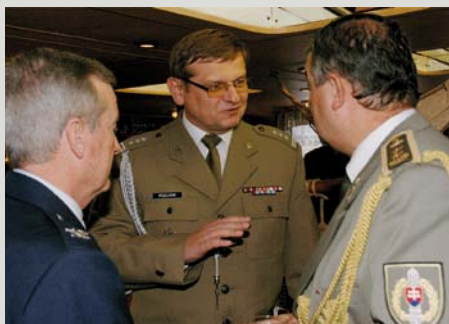
Na Tradičnej plavbe loďou po Vltave boli prítomní aj zástupcovia diplomatických a vojenských zástupiteľstiev v Českej republike