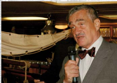
Z príhovoru podpredsedu vlády a ministra zahraničných vecí ČR Karla Schwarzenberga