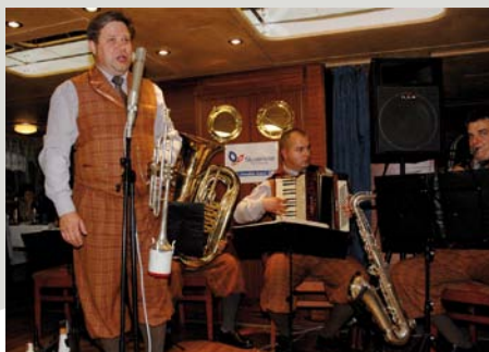
Na Tradičnej plavbe po Vltave vystúpila so svojim repertoárom aj slovenská skupina FUNNY FELLOWS