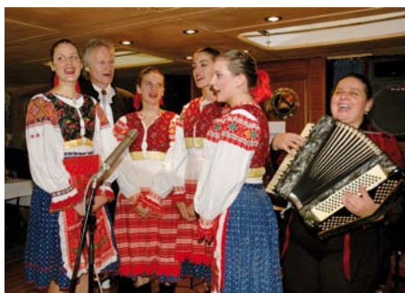
Z vystúpenia folklórneho súboru Limbora