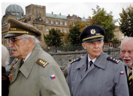
Príchod vojnových veteránov na loď Európe r.p.