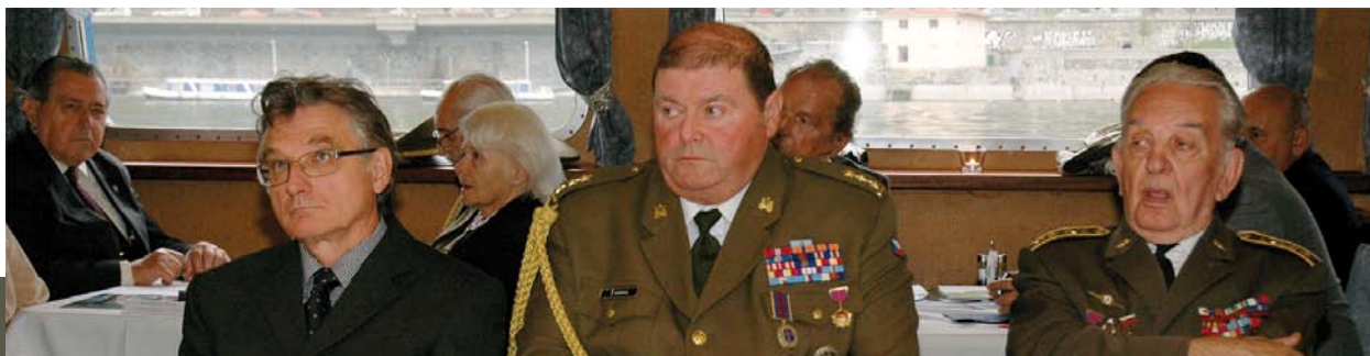
Vzácní hostia počúvajú na úvod slávnostné prejavy