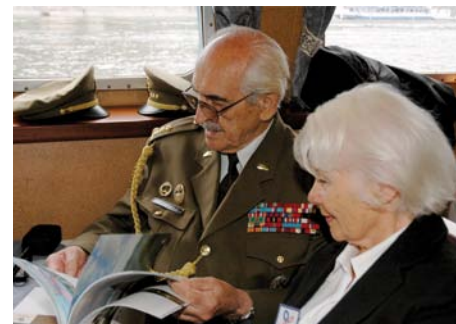
Na lodi zavládla dobrá nálada